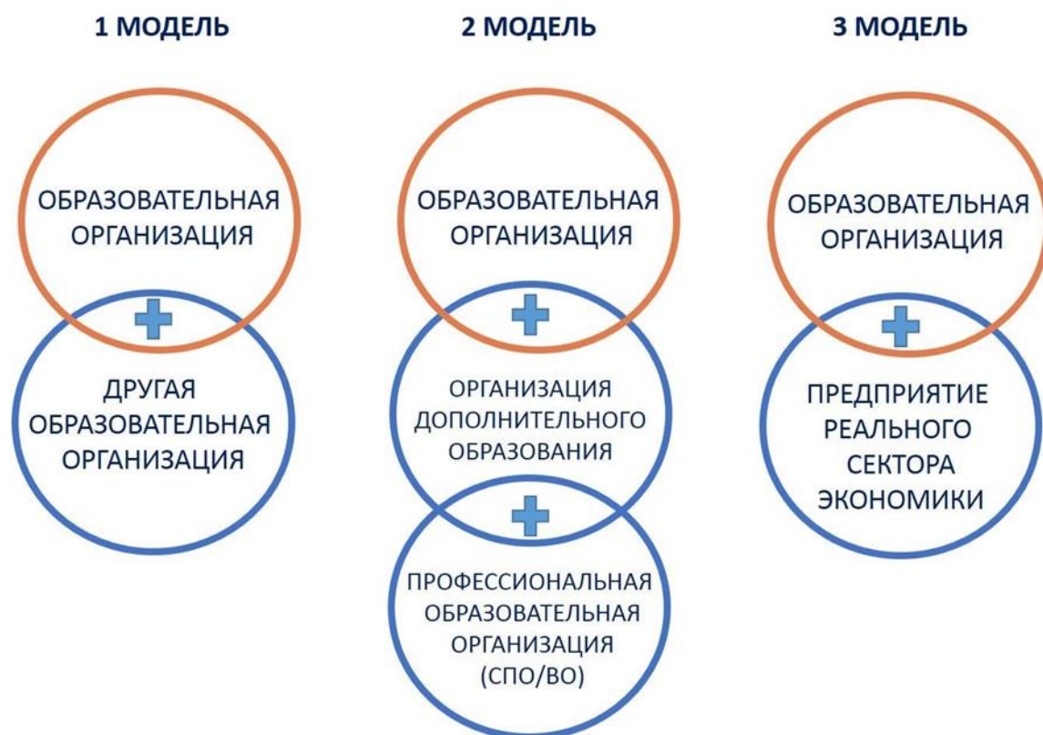
Рисунок 1. Модели сетевого взаимодействия

В зависимости от состава участников сетевого взаимодействия Министерство просвещения предлагает условные модели сетевого взаимодействия при совместной реализации образовательных программ, представленные на рисунке 1 [3]: