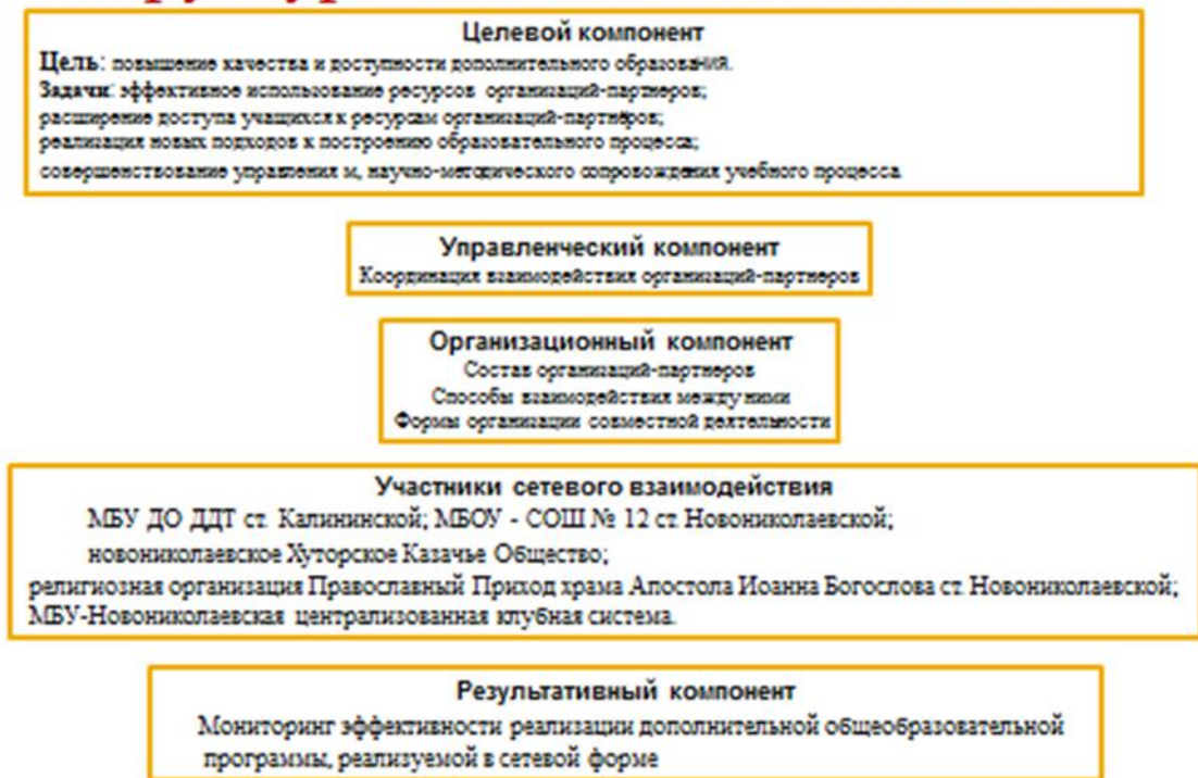
Рисунок 3. Структурные компоненты модели