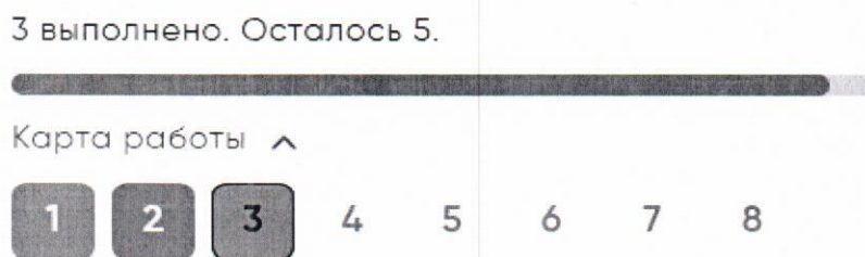
Рисунок 4. Карта работы

Если участник пропустил какой-то вопрос и хочет к нему вернуться, можно нажать кнопку «Назад» или выбрать номер пропущенного вопроса в карте работы. Вопрос, на который дан частичный ответ, на карте работы будет подсвечиваться серым цветом